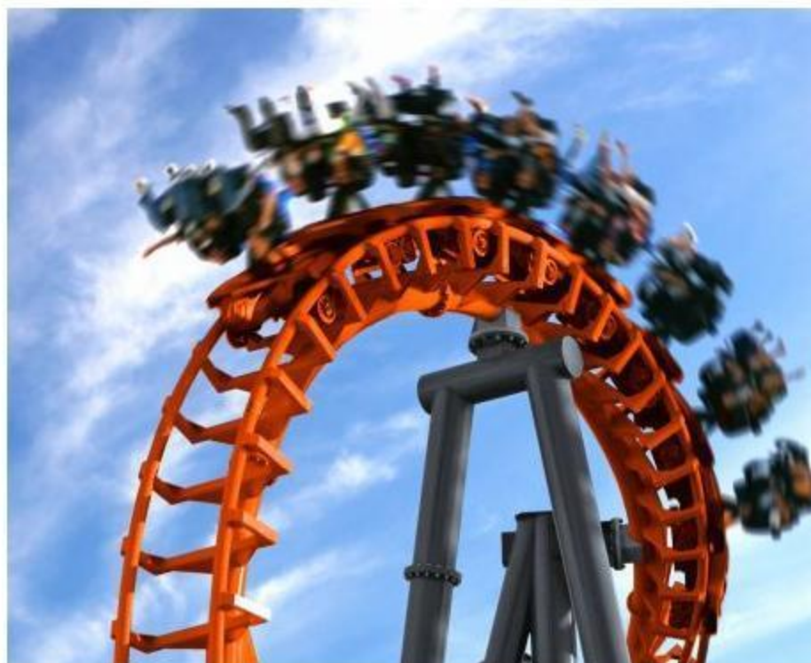
Forlystelsen Cobra er kørt galt i Tivoli Friheden. Arkivfoto.

To mænd og to kvinder på mellem 22 og 24 år er kommet til skade i Tivoli Friheden i Århus.